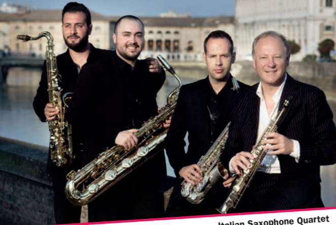
Italian Saxophone Quartet